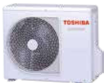
Zunanja naprava (simbolična slika)

→ Preprosta, prilagodljiva montaža Individualna izbira zračnega toka Učinek talnega ogrevanja